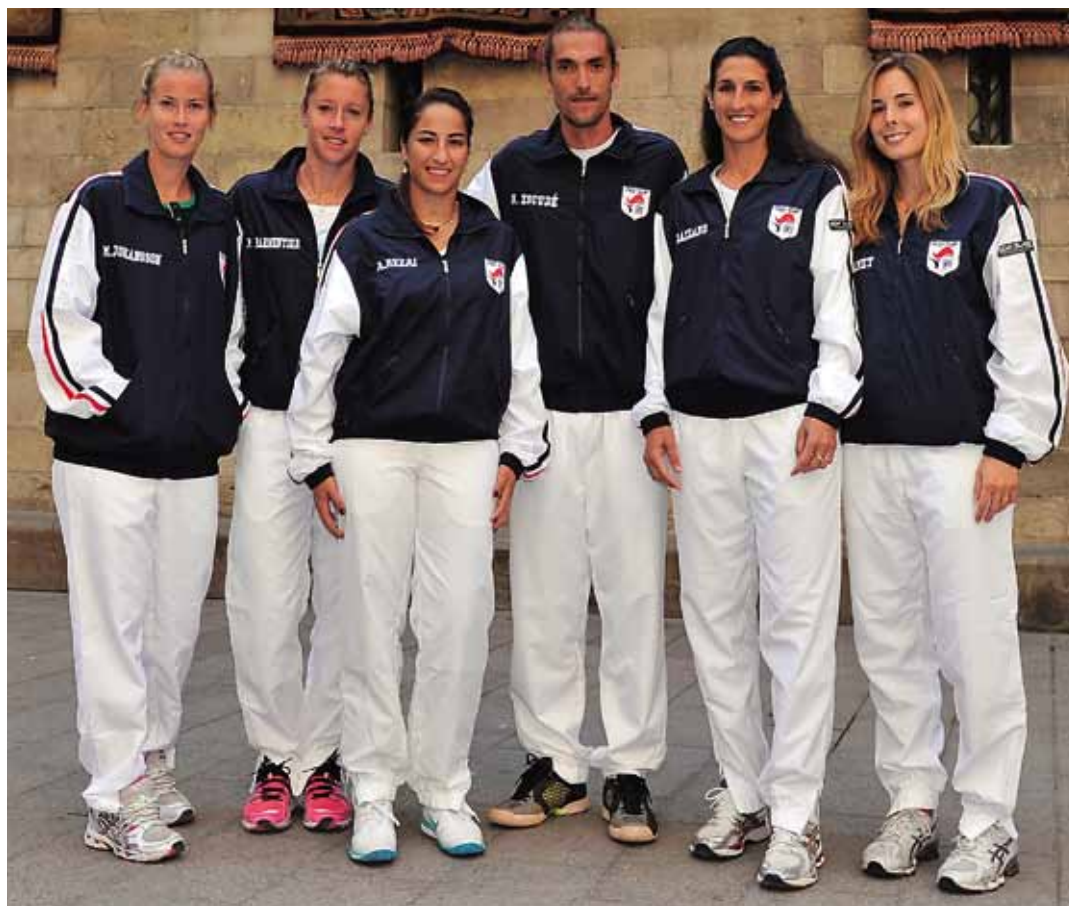
Francúzsko - zľava Mathilde JOHANSSONOVÁ, Pauline PARMENTIEROVÁ, Aravane REZAIOVÁ, Nicolas ESCUDÉ, Virginie RAZZANOVÁ, Alizé CORNETOVÁ