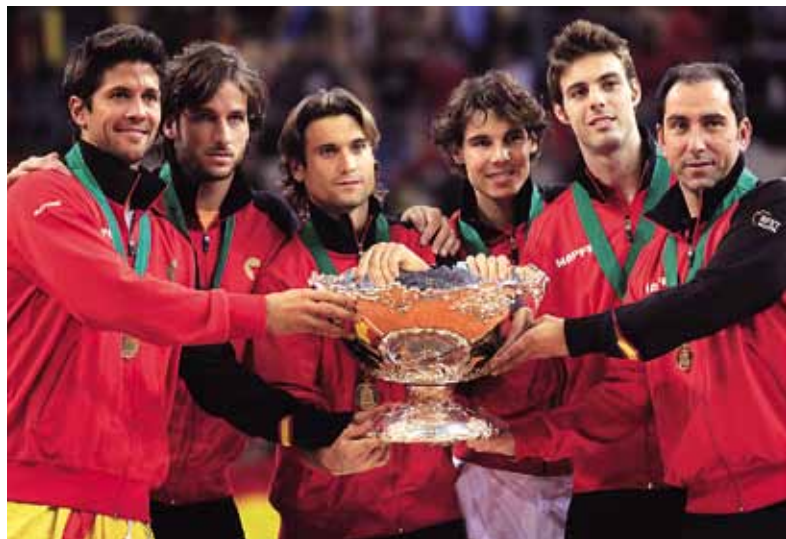
Vítazné Španielsko – zľava Fernando VERDASCO, Feliciano LOPEZ, David FERRER, Rafael NADAL, Marcel GRANOLLERS a kapitán Albert COSTA