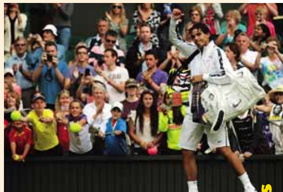
Takto sa Rafael NADAL lúčil so svojimi fanúšikmi tohto roku vo Wimbledonu